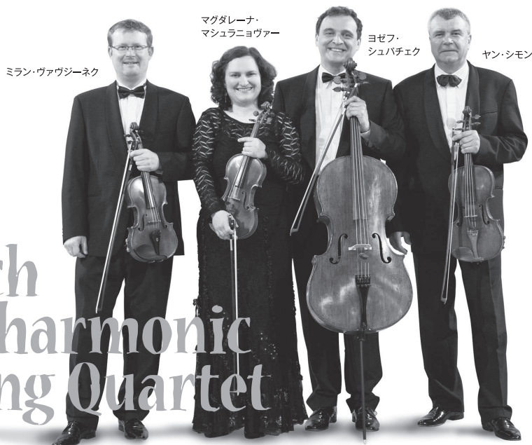
ミラン・ヴァヴジーネク

少々堅苦しいクラシック・コンサートの終わり近く、アンコールとして演奏される小品の美しいメロディーや軽快なリズムに、心も身体もいっぺんに解きほぐされて、はじめからこんな曲ばかり演奏してくれればいいのに…と、思われた方も多いのではないのでしょうか? そんな皆様にお薦めしたい、どなたもご存知の有名小品ばかりを揃えてお贈りする、幸せいっぱい“超名曲”コンサート! どこかで聞いた、あの曲この曲が何と20曲!! しかも演奏は、“弦の国”の伝統を支える名門オーケストラ「チェコ・フィル」弦楽器セクションの名手揃い。ツボを心得た名人たちの演奏で、不滅の名曲をご堪能いただける絶好の機会です。