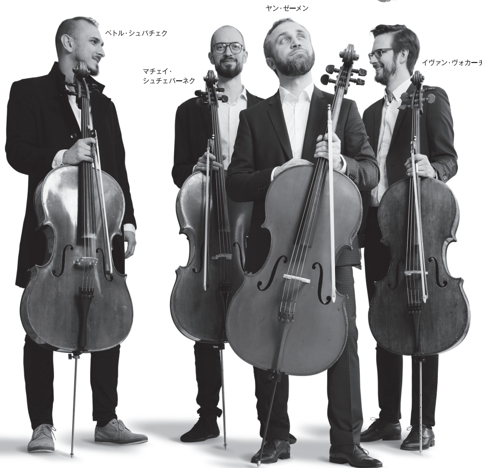
ベトル・シュパチェク Petr Špaček

動画『オペラ座の怪人』がYouTube再生回数3,000万突破の爆発的なヒットと、意欲的なCDや動画を立て続けにリリースし世界の注目を集めた「プラハ・チェロ・カルテット」の人気を牽引した中心メンバー3名に、輝かしい活動歴を持つトップクラスのチェリストが新たに加わり、2022年に誕生した新生チェロ四重奏団がこの「プラハ・チェロ・リパブリック」。さらなる進化を遂げ現代最先端の音楽シーンに躍り出た次代のスターである。メンバーそれぞれが数々のコンクールの受賞歴を持つ名手揃いでその実力は折り紙付き、世界各地からコンサートへの出演オファーが続々と寄せられている。練り上げられたアレンジとお洒落なステージ、クラシック、ロック&ポップスからミュージカル&映画音楽まで、多彩なプログラムと溢れるユーモアを駆使し最高レベルの音楽体験をお届けする。2022年9月、早くも来日公演を成功させ、同年10月にはデビュー CD「FREEDOM」をリリース。再来日を熱望する多くのファンの声に応え、2023年2月急きよ2度目の日本ツアーを実施。今回が早くも3度目の来日公演となる。 ※2024年1月現在